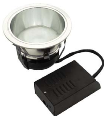
Mizar 170 E01 OP