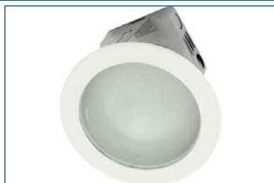
Ursa 118 I22 SOP