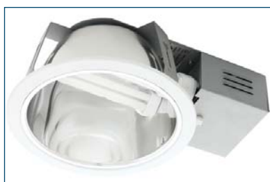
Orion 226 B28 GLR