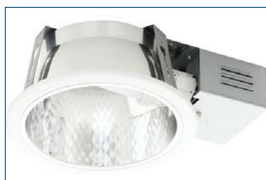
Orion 226 B28 FCT