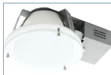
Orion 226 B28 OGL