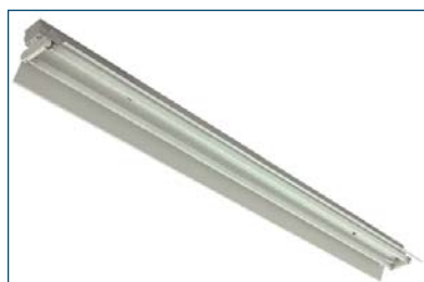
Alcor 228 A59 DeLuxe