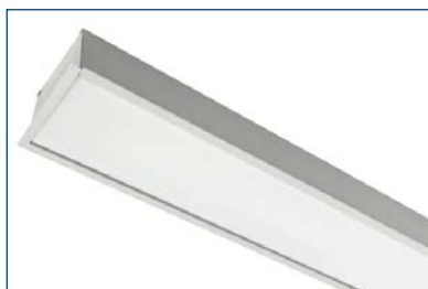
Serpens D LED2x1050 B169 T840 OP