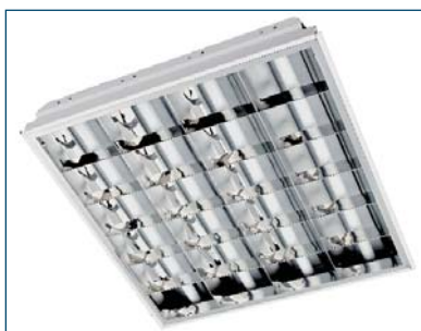
Breeze 418 I92