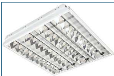
Breeze 414 F41 9CR