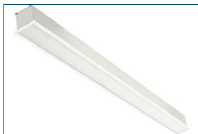
Serpens LED1x2350 B156 T840 OP