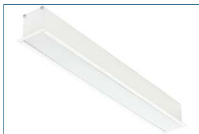
Serpens 114 M73 OP