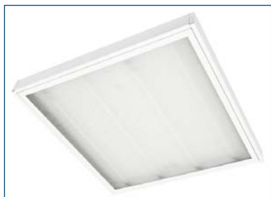
Marengo 414 S59