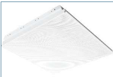
Marenco 418 F47