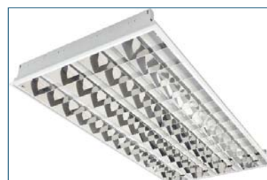
Breeze 436 C45