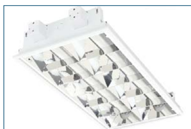
Breeze 218 C44