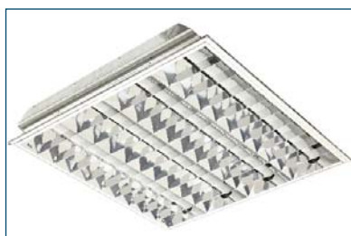
Breeze 418 A04 9CR