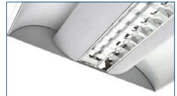
Jetta 414 D62