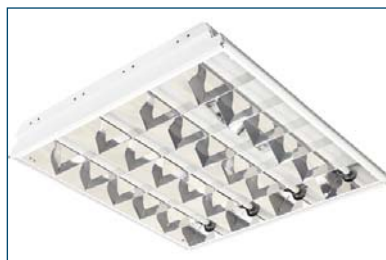
Breeze 414 F41