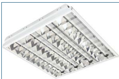
Breeze 414 F41 9CR